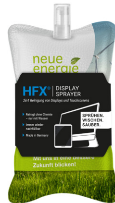
Ansicht der fertigen Banderole

— = Druckfläche ca. 190 x 66 mm inkl. 3 mm Beschnittzugabe