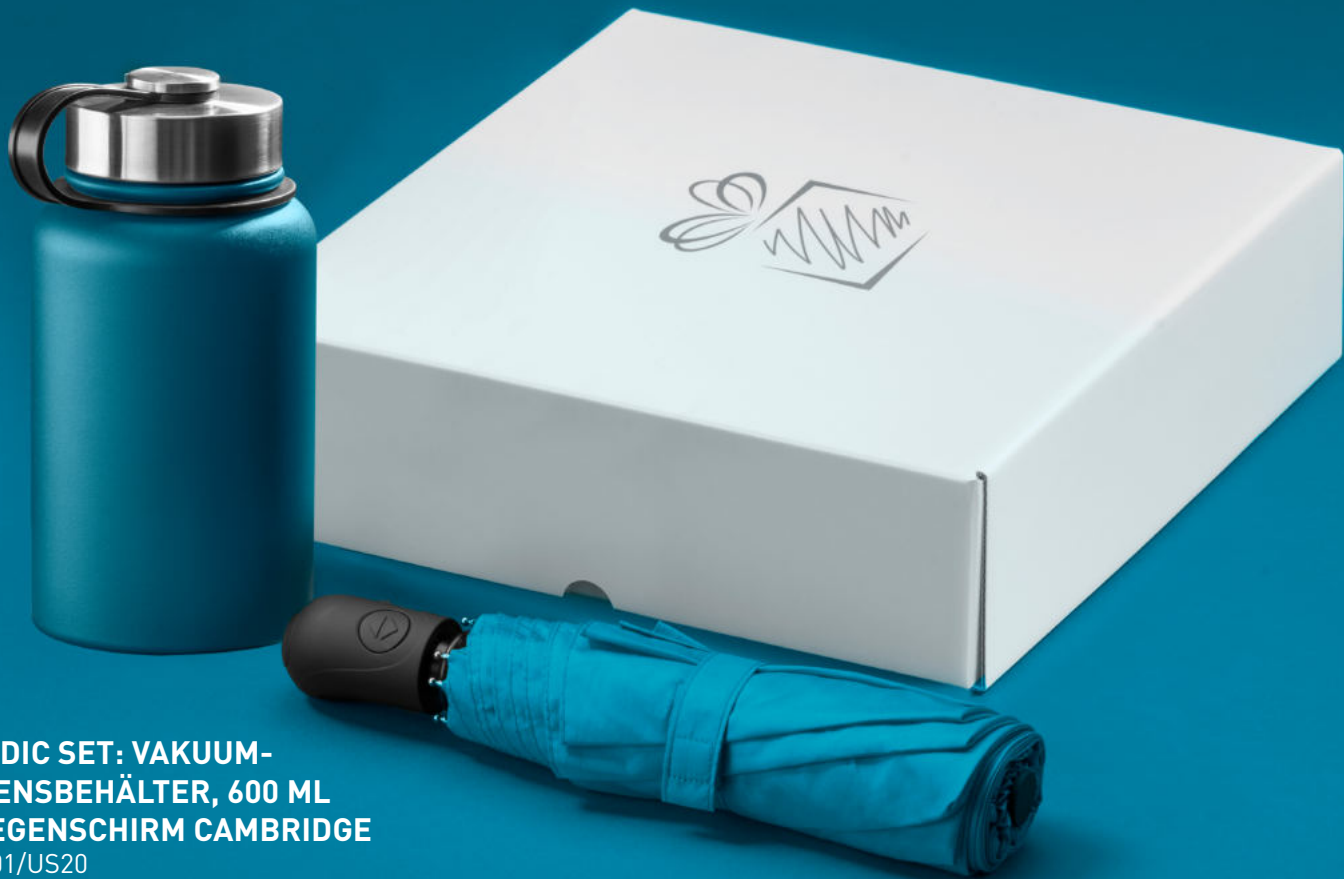
NORDIC SET: VAKUUM- ESSENSBEHÄLTER, 600 ML & REGENSCHIRM CAMBRIDGE HFN01/US20